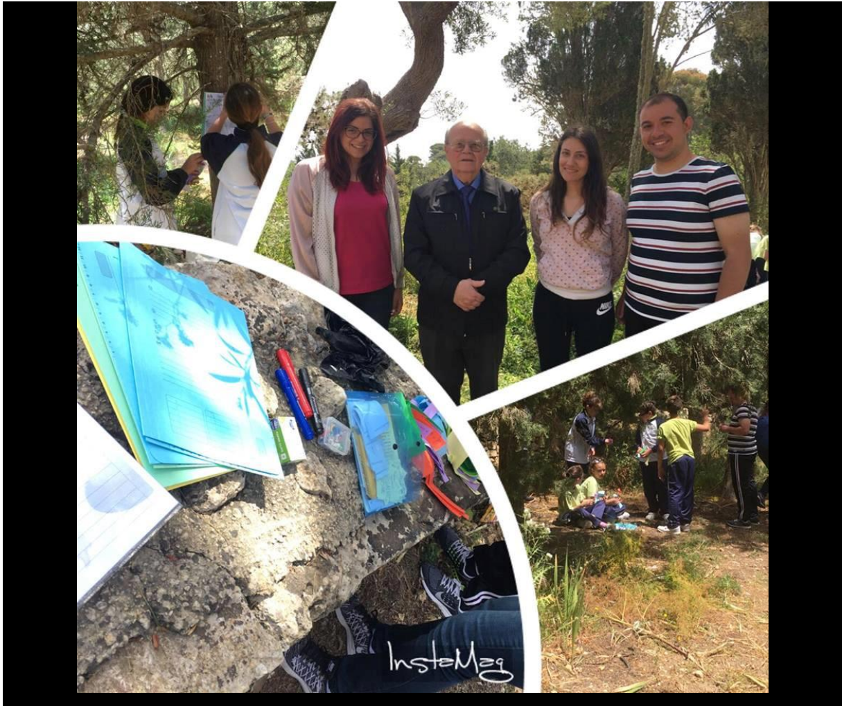
Taħdita mal-awtur, firem u indirizz lill-istudenti, entużjażmu għall-qari u l-kitba, kaċċa għat-teżor, sens ta' altruwiżmu, ħidma fi gruppi, sodisfazzjon tal-istudenti, sodisfazzjon kbir bħala għalliema... taġġlim ħolistiku... taġġlim għall-ħajja... il-gost li titgħallem waqt li qed tieħu gost... natura... paċi... serħan... esperjenzi... memorji... Apprezzament għall-ħajja... Fuq kollox l-istorja hi allegorija li tfisser l-imħabba li rridu ngħixu u l-paċi li rridu nkattru... 26.4.17