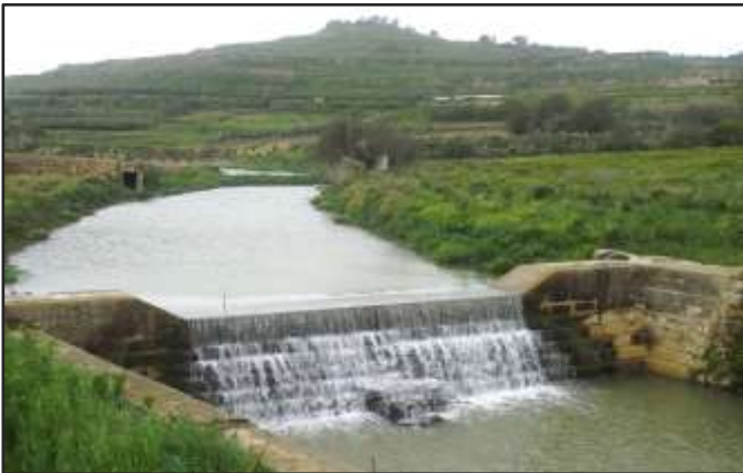
Wied il-Qlejgħa wara x-xita

Il-widien iservu ta' protezzjoni mill-għargħar u b'hekk permezz tagħhom nevitaw li l-għelieqi jegħrqu u l-ħamrija tingarr lejn ix-xtut. Biex wieħed jinduna kemm huma importanti l-widien, għandu jżur xi toroq li ħadu post il-widien bħal ngħidu aħna Triq il-Wied ta' Birkirkara u Triq l-Imnsida waqt ħalba xita. Mhux l-ewwel darba li tant jingabar ilma f'dawn l-inħawi li jegħrqu d-djar, jingarru l-karozzi u ssir ħafna ħsara lill-uċuħ tat-toroq. (par. 2)