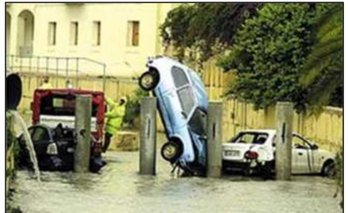
Triq il-Wied, Birkirkara, wara x-xita

Meta n-nom ikun fil-plural jindika ammont ta' persuni, oġġetti, postijiet jew ideat.